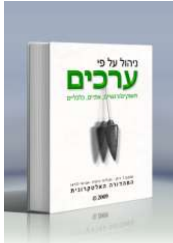
מהדורה שנייה אלקטרונית

ספר העיון: " ניהול על פי ערכים " - המהדורה האלקטרונית